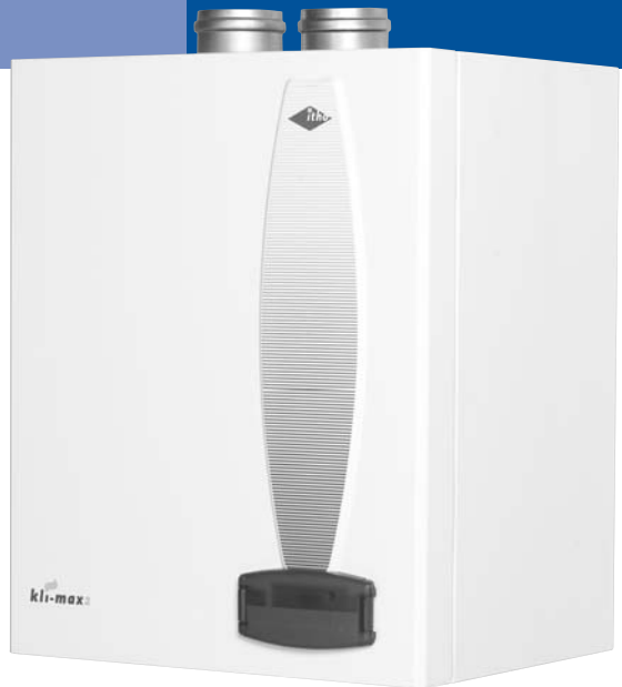
Itho HR-combiketel Kli-Max 2.

De verbranding in de ketels vindt plaats door een Econox gas/lucht voorgemengde stralingsbrander, die onder alle omstandigheden een optimale schone verbranding waarborgt.