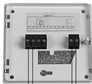
Potmeter 1.000 Ohm